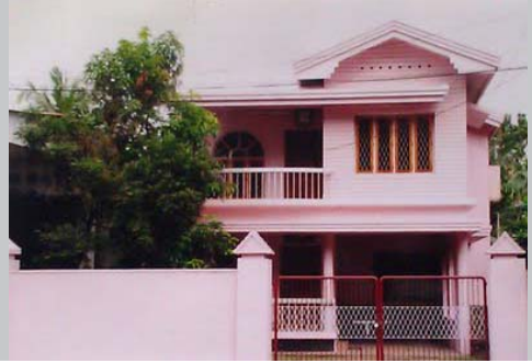
കോട്ടയം ടൗണിനടുത്ത് എസ്.എച്ച്. മൗണ്ട് ചുട്ടുവേലി ജംഗ്ഷനിൽ എം.സി.റോഡ് മുൻവശമായുള്ള 10 സെന്റ് സ്ഥലവും 2000 സ്ക്വയർ ഫീറ്റ് രണ്ടു നില വീടും വിലപനയ്ക്ക്. പള്ളിയും, സ്കൂളും, ടൗണും വളരെയടുത്തുള്ള ഈ സ്ഥലത്തെപ്പറ്റി കൂടുതൽ അറിയുവാൻ വിളിക്കുക. ഫോൺ 1 408 244 1706 (യു.എസ്.എ.), 1 408 480 5484 (യു.എസ്.എ.)